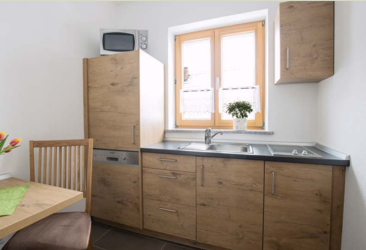
Gemeinschafts-Teeküche mit Sitzgelegenheit für 2 Personen