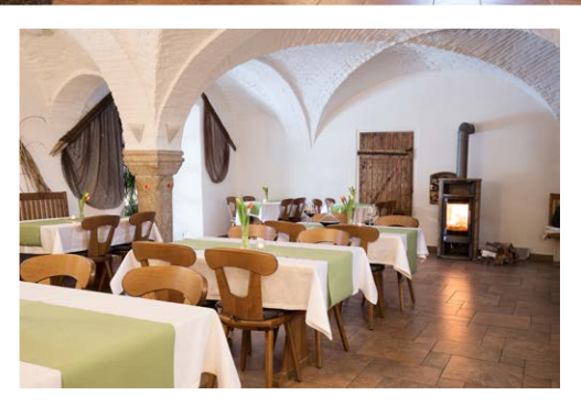
Frühstücken, Essen oder Feiern im gemütlichen Ambiente unter dem über 200 Jahre alten Gewölbe. An kalten Wintertagen sorgt unser Schwedenofen für Wohlfühlathmosphäre.